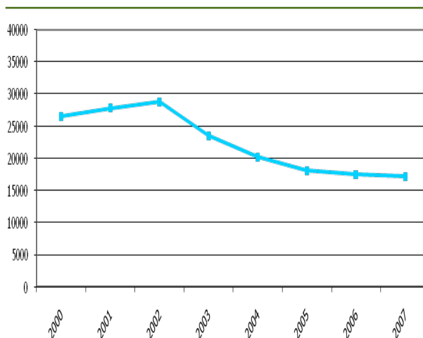
Gráfica 2 Homicidio 2000-2007

Fuente: Datos del Centro de Investigaciones Criminológicas, Dirección de Investigación Criminal.