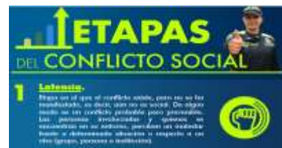
Difusión por medio del Noticiero Vocación Policial

Durante la implementación del Plan de Comunicaciones en materia de Transformación de conflictos sociales y prevención policial con enfoque comunitario, se determinaron las actividades como cuñas radiales, difusión de tips informativos sobre el desescalamiento de conflictos, video sobre prevención con enfoque comunitario en el noticiero vocación policial, infografía sobre las etapas del conflicto social y desarrollo de una pieza gráfica sobre transformación de conflictos en los medios internos.