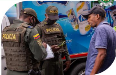
Afianzando la pedagogía y Cultura Ciudadana

27.054 Compartimientos contrarios a la convivencia atendidos 317 mediaciones policiales 01 diarias promedio 2.765 Incautación de Arma blanca ↓17% Reducción del homicidio por riña