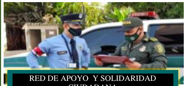
RED DE APOYO Y SOLIDARIDAD CIUDADANA