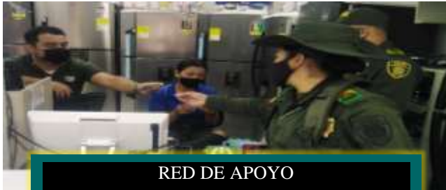
RED DE APOYO RED DE APOYO Y COMUNICACIONES