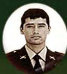
INTENDENTE JORGE TRUJILLO SOLARTE 1999