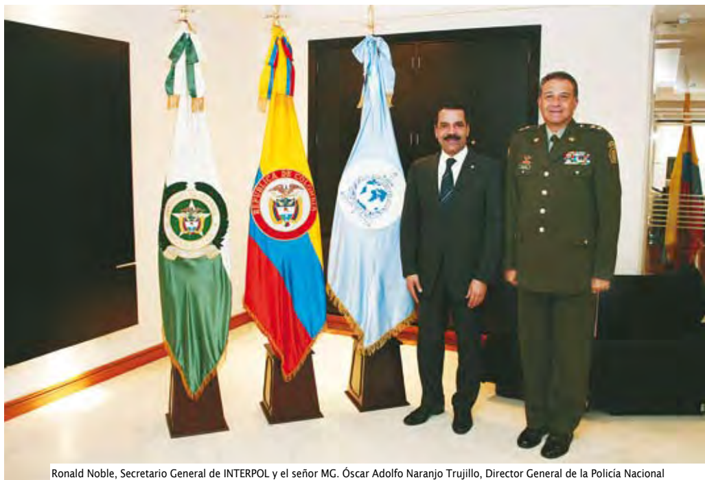
Ronald Noble, Secretario General de INTERPOL y el señor MG. Óscar Adolfo Naranjo Trujillo, Director General de la Policía Nacional