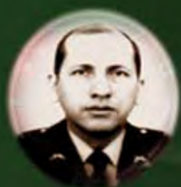
MAYOR GENERAL LUÍS HERLINDO MENDIETA OVALLE 1998