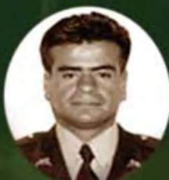
INTENDENTE ALVARO MORENO 1999