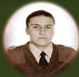
MAYOR ÉLKIN HERNÁNDEZ RIVAS 1998