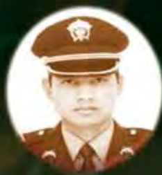
MAYOR GUILLERMO JAVIER SOLÓRZANO 2006